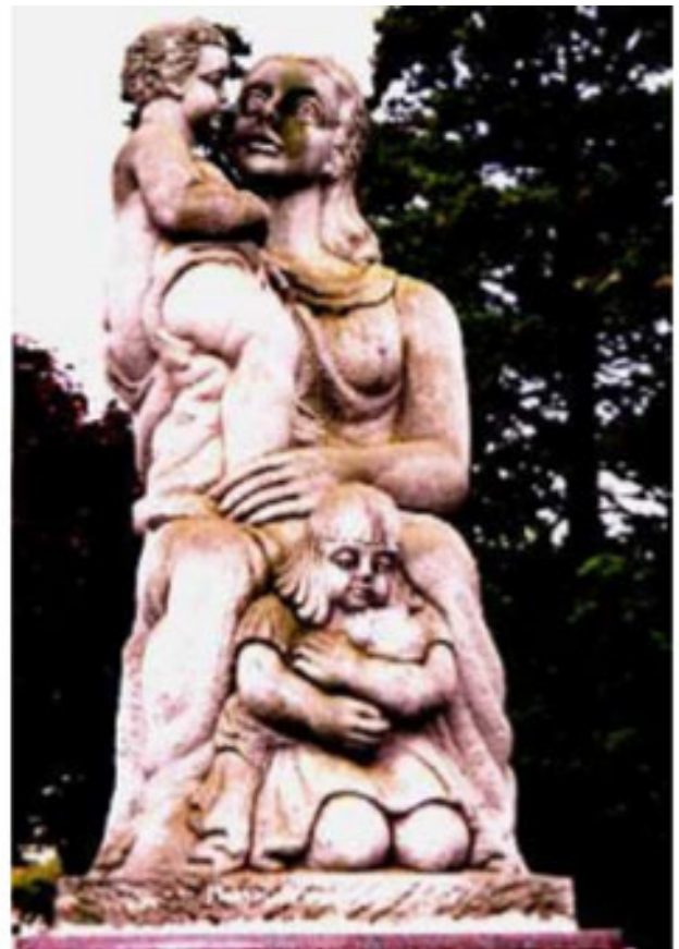
Figura 7. Monumento un año después de la limpieza

El crecimiento de seres vivos sobre la piedra puede llegar a producir daños de diversa consideración. El problema de las colonias de biocolonizadores es que, aunque suelen ser fáciles de eliminar, si permanecen las condiciones favorables para su desarrollo vuelven a aparecer al cabo de un corto tiempo. La única solución es un mantenimiento periódico (Fig. 7).