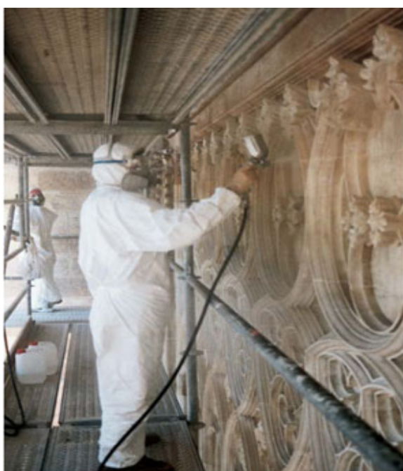
Figura 9. Consolidación de la laceria en Las Torres de Serrano en Valencia.

En lo que respecta a la consolidación, el material utilizado es un agente consolidante líquido que debe penetrar profundamente en la piedra, mejorando su cohesión interna, la adhesión entre las partes dañadas y aquellas no alteradas. La finalidad del consolidante es reducir la porosidad del material, para disminuir su susceptibilidad al ataque químico del agua y a su vez la colonización de organismos (líquenes y algas). Se recomienda usar un consolidante compuesto por ésteres etílicos del ácido silícico y polixiloxanos oligoméricos, disueltos en aguarrás mineral para un óptimo grado de absorción hasta el núcleo sano de la piedra. Los ésteres etílicos reaccionan y se transforman en el gel de sílice y alcohol etílico. Muchos de los productos utilizados comúnmente como consolidantes tienen propiedades hidrorrepelentes hidrofugantes, lo que les confiere un efecto protector.