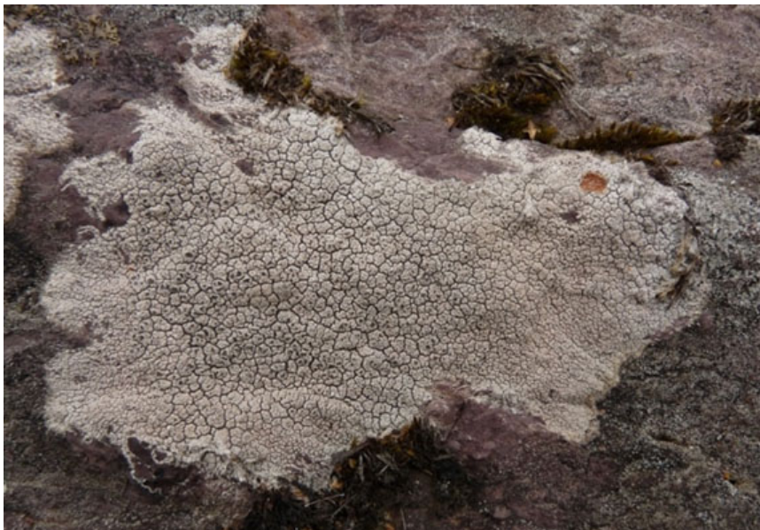
Figura 1. Líquen crustáceo, Diploschistes scruposus , grisáceo recuerda ceniza sobre roca

Según el aspecto que presenta la morfología del talo, se pueden diferenciar seis biotipos de líquen: fruticulosos, foliáceos, gelatinosos, de talo compuesto, escumulosos y crustáceos o incrustantes. En este documento nos centraremos en los líquenes de tipo crustáceo, más exactamente los que crecen en las rocas denominados líquenes saxícolas; los líquenes epilíticos crecen sobre la superficie rocosa mientras que los endolíticos se desarrollan en su interior.