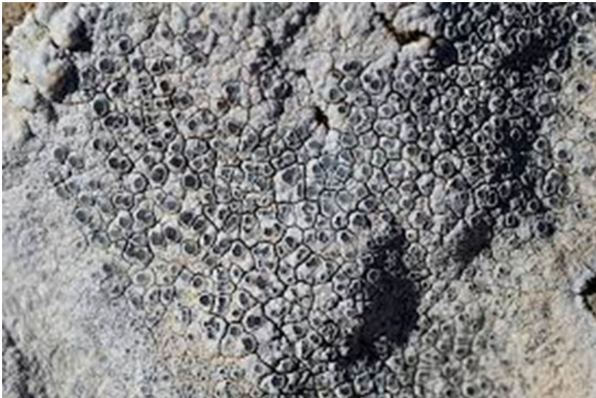
Figura 3. Dimelaena oreina , líquen sobre rocas silíceas en la cuenca mediterránea

Los géneros Lecanora y Placynthium se desarrollan sobre sustratos calcáreos, entre los que se incluyen el hormigón, los cementos y las argamasas. Por el contrario, los géneros Umbilicaria , Xanthoparmelia y Pseudephebe prefieren sustratos de naturaleza silíceas.