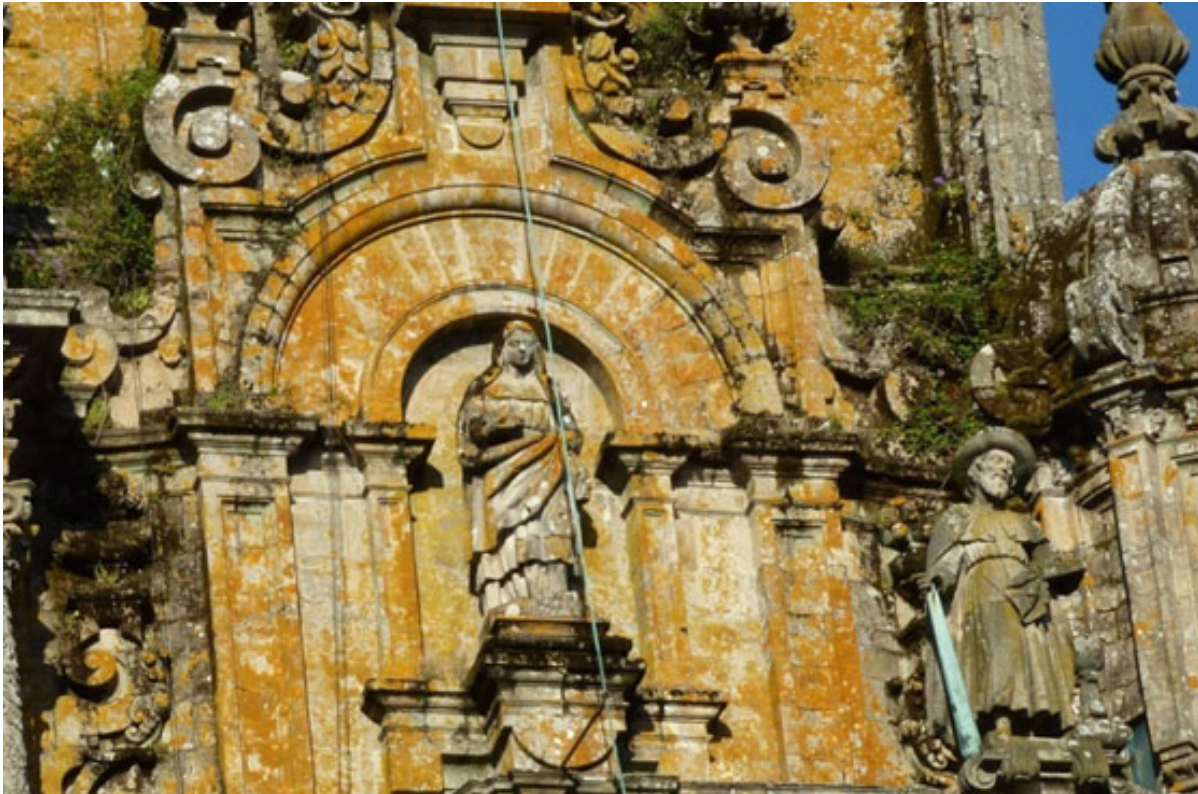
Figura 5. Fachada de la catedral de Santiago, donde se aprecia la colonización por parte de líquenes

En los trabajos de recuperación y puesta en valor de edificios históricos o monumentos pertenecientes al patrimonio cultural de una región, la limpieza de las superficies cobra un interés particular: esta es una