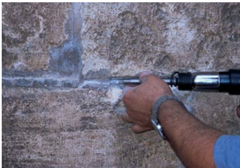
Figura 8. Herramienta mecánica para el repicado de las juntas.

Hay una gran cantidad de métodos que se emplean para la limpieza de monumentos y edificios, pero muchos de ellos no resultan suficientemente eficaces. Uno de estos métodos es la eliminación mecánica de los organismos, consiste en la remoción manual de las estructuras liquénicas; su baja efectividad se debe a que, generalmente, no se eliminan totalmente los organismos, sino únicamente la parte superficial, permitiendo que permanezcan las estructuras que crecen en profundidad y, por tanto, dándole la oportunidad de reproducirse de nuevo (Fig. 8). Pese a su baja eficacia como método de limpieza propiamente dicho, tiene una función útil en la rutina de mantenimiento y en los primeros pasos de limpieza, especialmente cuando es necesario reducir la biomasa para luego proceder con otros tratamientos.