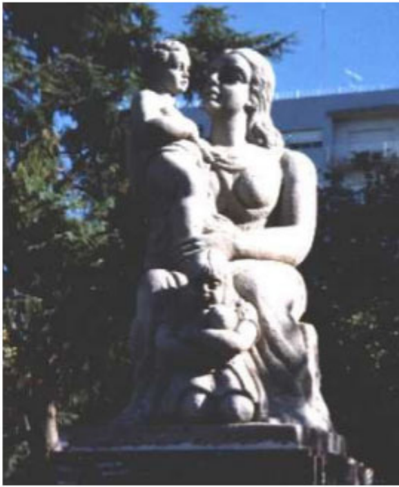
Figura 6. Monumento recién limpiado

El crecimiento de seres vivos sobre la piedra puede llegar a producir daños de diversa consideración. El problema de las colonias de biocolonizadores es que, aunque suelen ser fáciles de eliminar, si permanecen las condiciones favorables para su desarrollo vuelven a aparecer al cabo de un corto tiempo. La única solución es un mantenimiento periódico (Fig. 7).