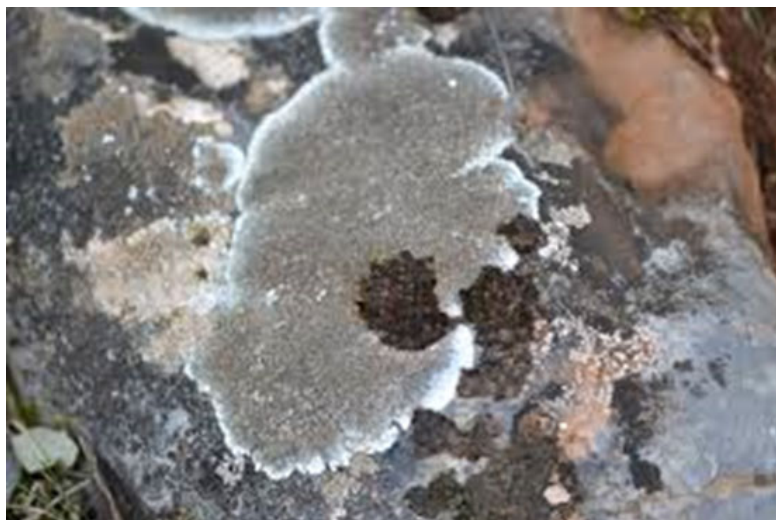
Figura 4. Lobothallia radiosa , líquen desarrollado sobre rocas calcáreas

El pH del sustrato afecta a la formación de iones lo que influye en varios aspectos de la biología del líquen, como la alteración química de la roca. Las rocas calcáreas tienen un pH básico mientras que las rocas silíceas tienen un pH ácido. Esta diferencia es el principal motivo por el que presentan comunidades de líquenes muy diferentes (Fig. 4).